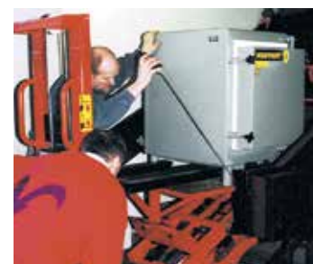
Поставка на место эксплуатации, включая инструктаж по работе с печью.

Неважно, где должна стоять печь - в подвале или на втором этаже. Наш специалист в кратчайшее время доставит печь в любое место. После установки печь приводится в готовность к эксплуатации. Индивидуальный инструктаж, разумеется, входит в пакет услуг.