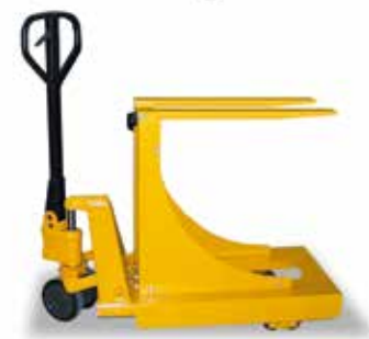
Погрузчик с установленной загрузочной рамой

Загрузочная рама для камерных печей начиная с N и выше 150ff. Рама с полками вводится в печь с помощью вилочного погрузчика. Максимальная ширина вилок погрузчика должна составлять 520 мм (максимальная масса загрузки 150 кг).