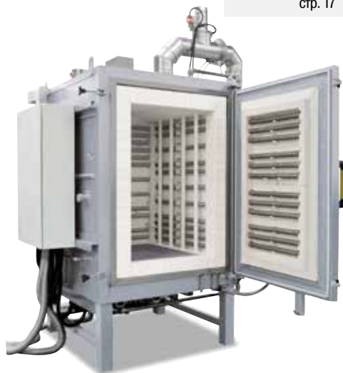
Комбинированная камерная печь N 650/HDB для выжигания и спекания на воздухе см. страницу 24