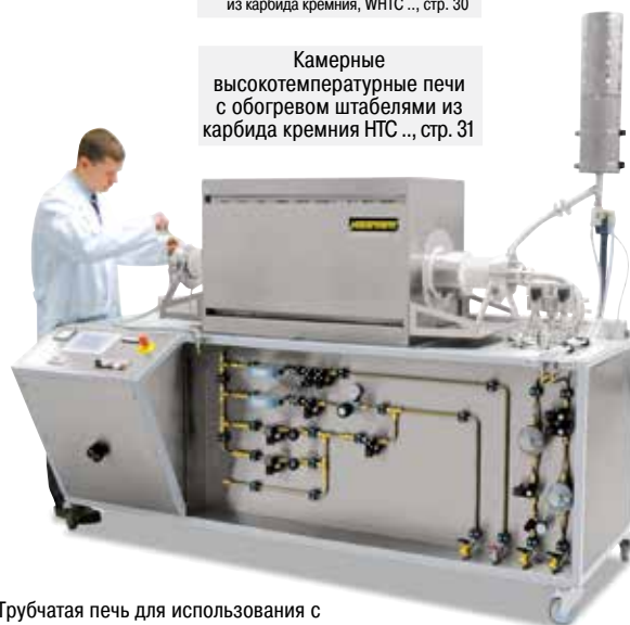
Трубчатая печь для использования с водородом см. страницу 77