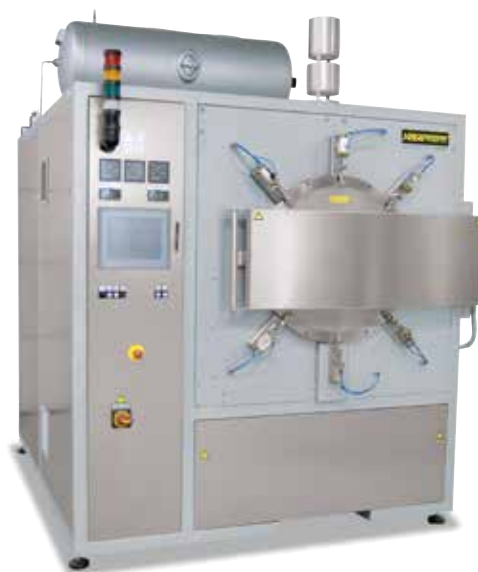
Печь с ретортой и с устройством безопасности, модель NRA .. для спекания под водородом см. страницу 46