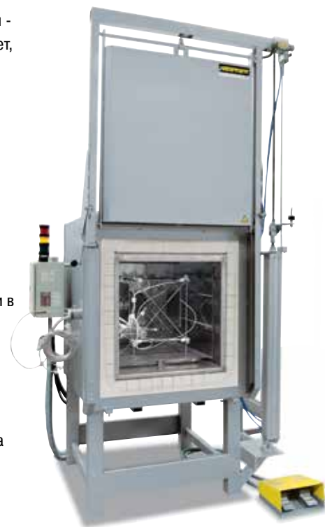
Измерительная рама для определения однородности температуры

Компания Nabertherm предлагает соответствующие решения для исполнения печей и систем управления в соответствии с отраслевыми стандартами, как, например, AMS 2750 E, CQI-9, FDA. См. наш каталог «Технологии термических процессов»